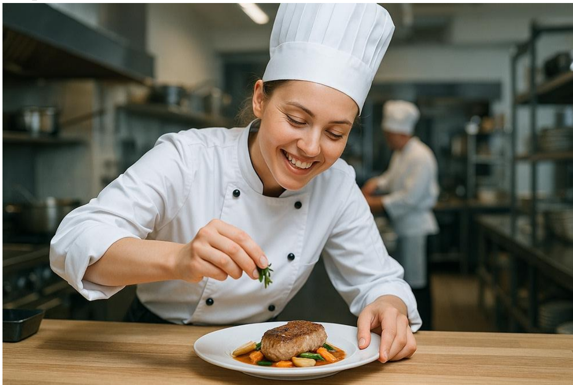
Фото 1 – Порционирование стейка из говядины с овощами соте