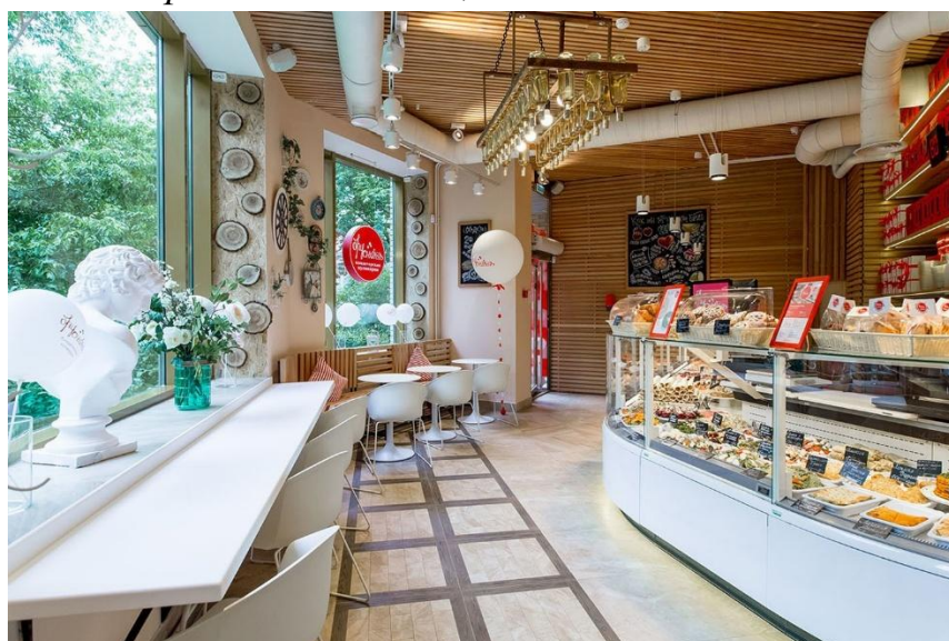
Рис.1 – Интерьер кафе – кондитерской “Булка и круассан”

Руководителем практики от предприятия был пекарь-кондитер высшей категории — Асанов Ерлан Саматович, тел.: +7 707 123 45 67.