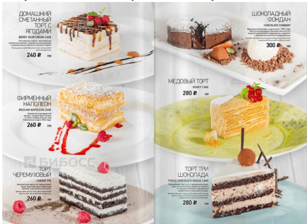
Рис.2 – Меню ИП «Bakery House»

На витрине и в социальных сетях регулярно появляются новинки, например, безглютеновые торты, чизкейки без сахара, постные десерты.