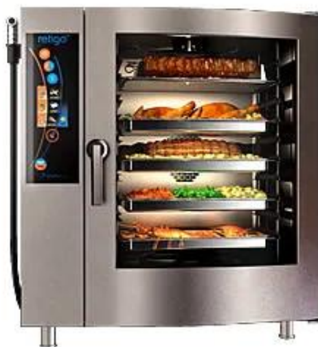
Рис. 3 – Пароконвектомат UNOX XEVC-0311-E1R